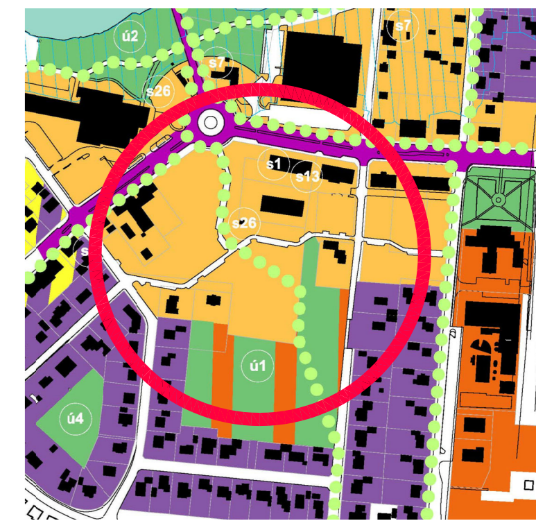
Árborg aðalskipulag 2010-2030, úr þéttbýlisupprætti fyrir Selfoss