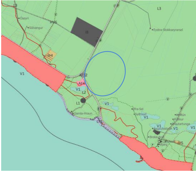
MYND 2. Hluti af Aðalskipulagi Árborgar 2020-2036 dreifbýli. Breytingin nær til svæðisins innan bláa hringsins.